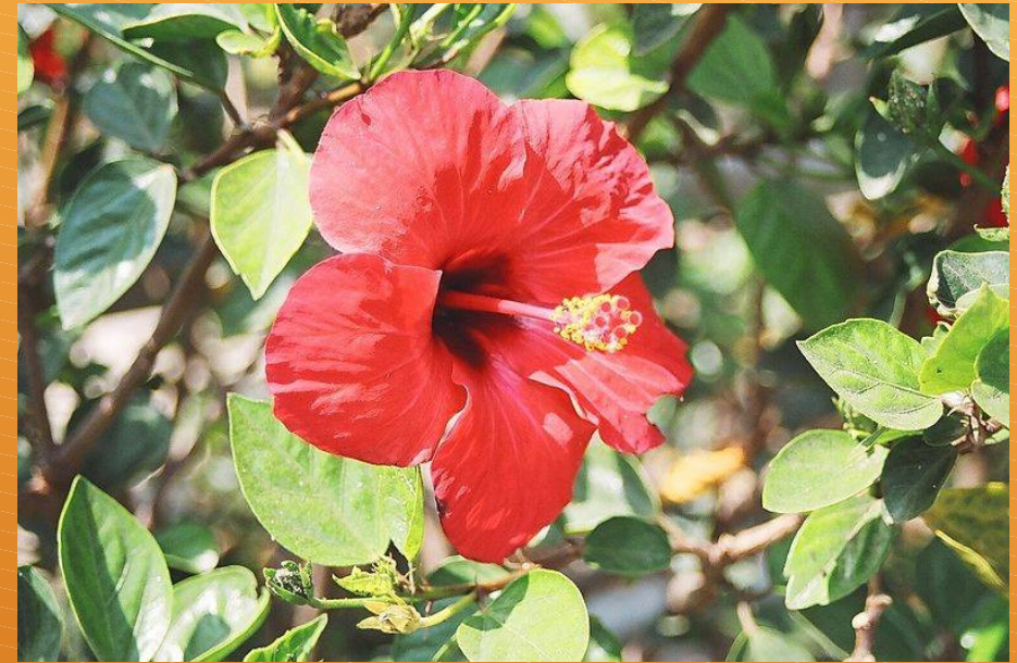
La flor de Jamaica