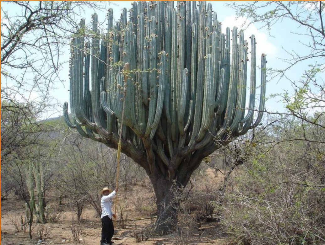
El cactus más grande del mundo