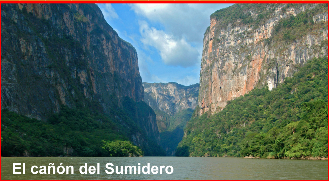
El cañón del Sumidero