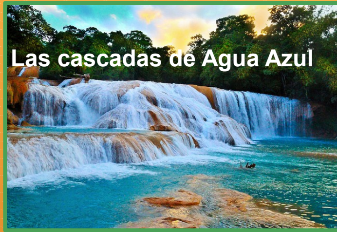
Las cascadas de Agua Azul